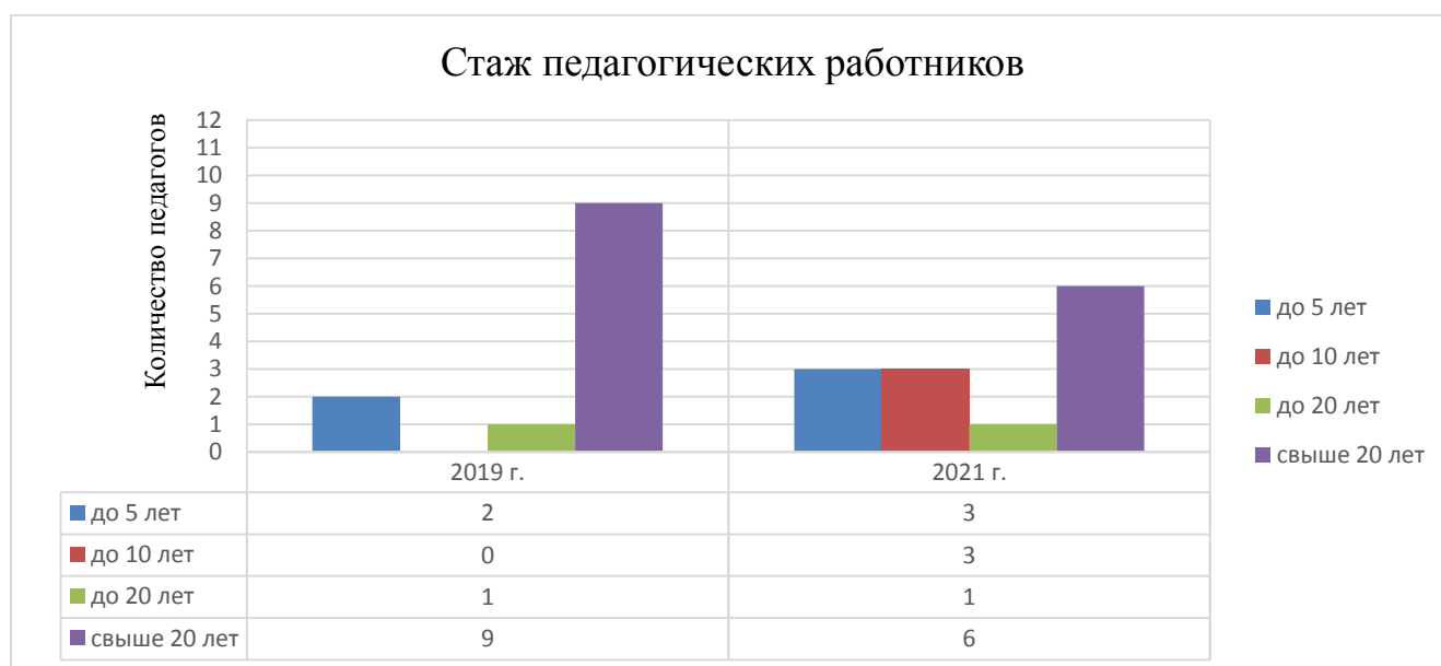
Диаграмма с характеристиками кадрового состава ДОУ

В 2021 году педагоги Детского сада приняли участие в следующих мероприятиях: